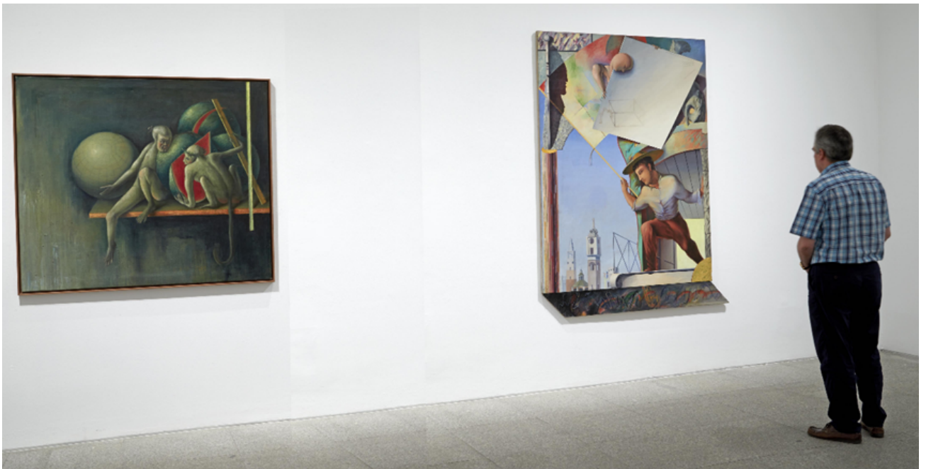
Vista de sala de la exposición SOLEDAD LORENZO. Punto de Encuentro.

Esta información se debe anexar en documentación adjunta.